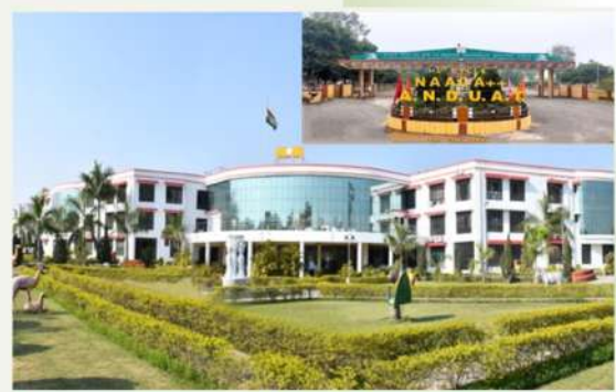
आचार्य नरेन्द्र देव कृषि एवं प्रौ० विश्वविद्यालय, कुमारगंज, अयोध्या-224229 (उ०प्र०)