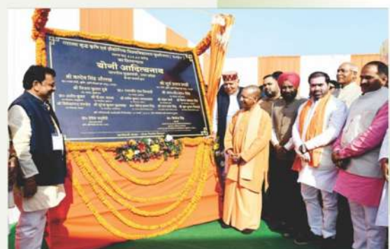
महात्मा बुद्ध कृषि एवं प्रौद्योगिक विश्वविद्यालय, कुशीनगर (उ०प्र०)