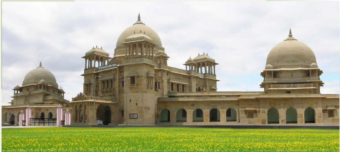
चन्द्रशेखर आजाद कृषि एवं प्रौद्योगिक विश्वविद्यालय, कानपुर-208002 (उ०प्र०)