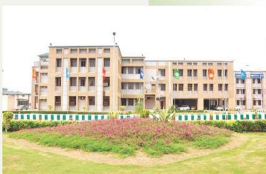
सरदार वल्लभभाई पटेल कृषि एवं प्रौ० विश्वविद्यालय, मेरठ-250110 (उ०प्र०)