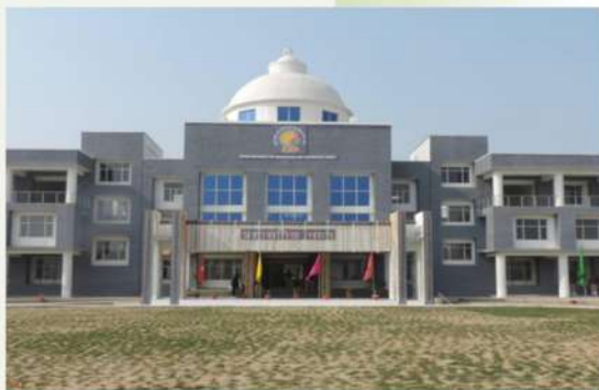
बोंदा कृषि एवं प्रौ० विश्वविद्यालय, बोंदा-210001 (उ०प्र०)